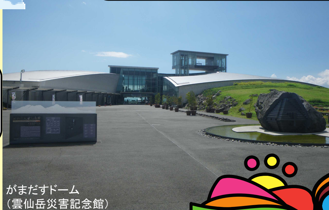
がまだすドーム (雲仙岳災害記念館)